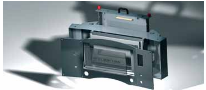
Mesa de um vibrascópio, MG Cimadomo 38 Meylan.