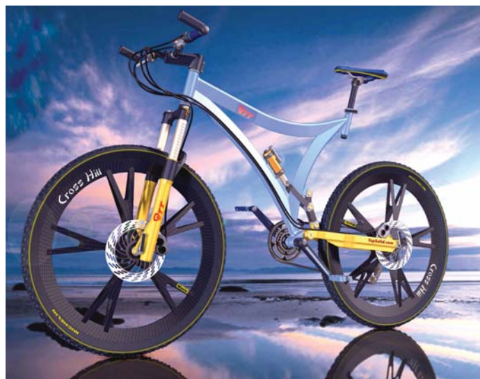
Design e renderização realística de um protótipo de uma mountain bike.